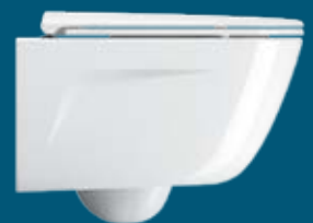
New Light 53